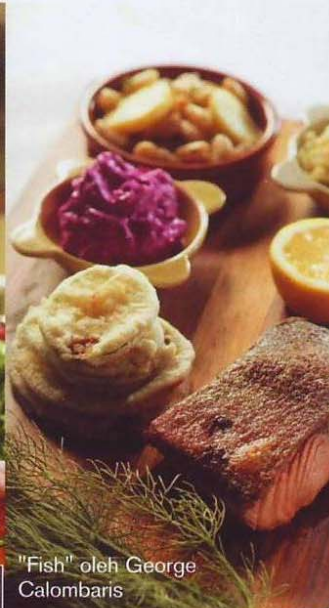
"Fish" oleh George Calombaris