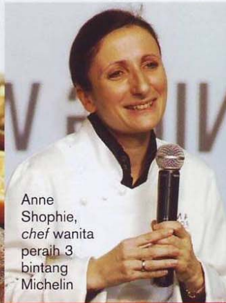
Anne Shophie, chef wanita peraih 3 bintang Michelin